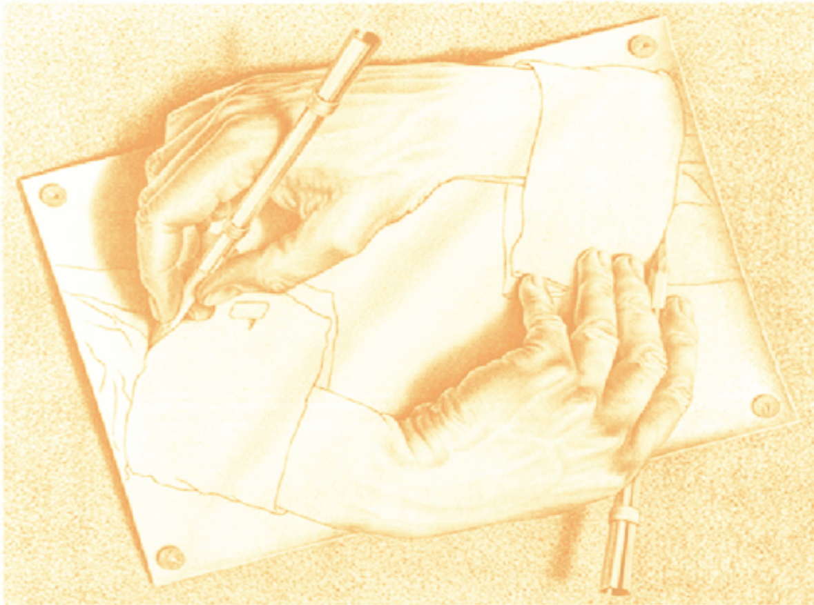
Figure 2: Escher hands

Vivamus sed nibh ac metus tristique tristique a vitae ante. Sed lobortis mi ut arcu fringilla et adipiscing ligula rutrum. Aenean turpis velit, placerat eget tincidunt nec, ornare in nisl. In placerat.